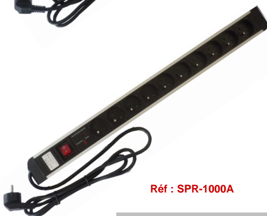
Réf : SPR-1000A

10 Prises : 16A, 250 V AC, bouton ON/OFF et protection anti-surtension - Prises 2P + T standards avec protection enfants - Avec câble H05W-F 3G1.5mm 2 + prise