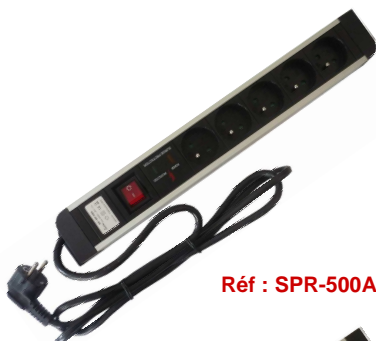
Réf : SPR-500A

5 Prises : 16A, 250 V AC, bouton ON/OFF et protection anti-surtension - Prises 2P + T standards avec protection enfants - Avec câble H05W-F 3G1.5mm 2 + prise