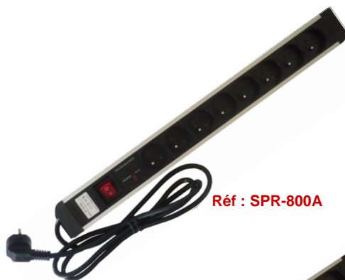
Réf : SPR-800A

8 Prises : 16A, 250 V AC, bouton ON/OFF et protection anti-surtension - Prises 2P + T standards avec protection enfants - Avec câble H05W-F 3G1.5mm 2 + prise