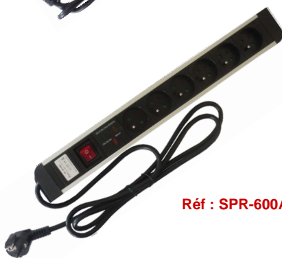
Réf : SPR-600A

6 Prises : 16A, 250 V AC, bouton ON/OFF et protection anti-surtension - Prises 2P + T standards avec protection enfants - Avec câble H05W-F 3G1.5mm 2 + prise